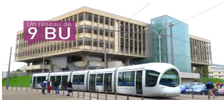
Figure – Photo de notre bibliothèque Lyon 1

Exemple : insertion de l'image de la BU centrale