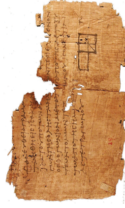
FIGURE I.2.: Un fragment des éléments d'Euclide, papyrus daté d'entre 75 et 125 de notre ère.

Euclide est un mathématicien de la Grèce antique né vers 325 av. J.C. et mort vers 265 av. J.C.. Nous n'avons que très peu d'information sur la vie d'Euclide. L'article de Fabio Acerbi du site Image des mathématiques 1 présente ce que nous savons à ce jour sur le personnage d'Euclide. Euclide est l'auteur des Éléments qui est un texte fondateur de la géométrie.