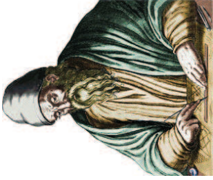
FIGURE I.1.: Euclide de Samos (325 - 265 av. J.-C.)